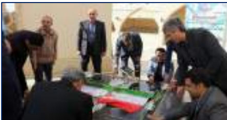
تجدید میثاق و ادای احترام دانشگاهیان علوم پزشکی استان سمنان با شهدای خوشنام دانشگاه