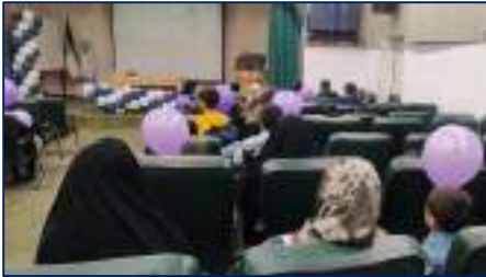
جشن روز جهانی نوزاد نارس در بیمارستان امیرالمومنین (ع) برگزار شد