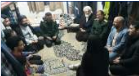
بازدید سرزده فرمانده سپاه استان سمنان از خوابگاه برادران مستقر در آرادان ۱۴۰۲/۰۹/۰۶