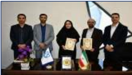
انعقاد تفاهم نامه همکاری بین کتابخانه مرکزی دانشگاه علوم پزشکی استان سمنان و دانشگاه سمنان