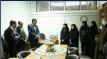
بازدید اعضای هیات رئیسه دانشگاه از حوزه های دانشجویی پدیس آموزشی پژوهشی دانشگاه ۱۴۰۲/۰۹/۰۵