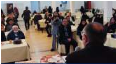
دوره می جای پند پهلو ویژه بیماران دیابتی و خانواده آن ها در شه میرزاد برگزار شد