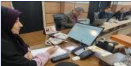
اولین جلسه کمیته فنی "نان کامل و غذای سالم در سفره مردم" برگزار شد ۱۴۰۲/۰۹/۰۶